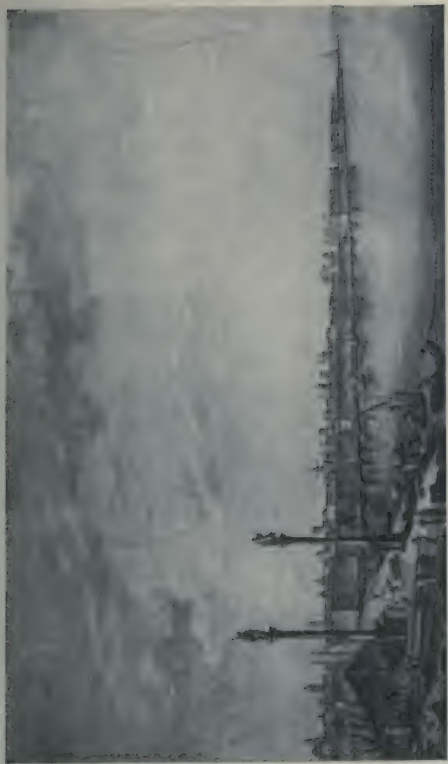
Vue du port de Cadix. Gravée par Thomas Lopez Enguid. (Bibliothèque Nationale. Estampes.)